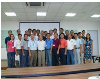
捷安特中國企業專班學員合照 (台灣上市)