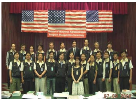
金寶集團企業專班(台灣上市)學員合照