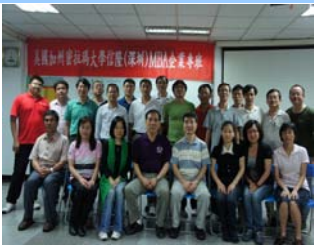
信隆企業專班學員合照 (深圳上市)