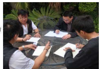
亞力山卓企業專班(深圳)學員小組討論情形