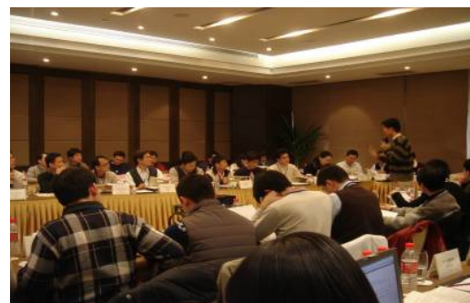
可成科技企業專班(台灣上市)上課